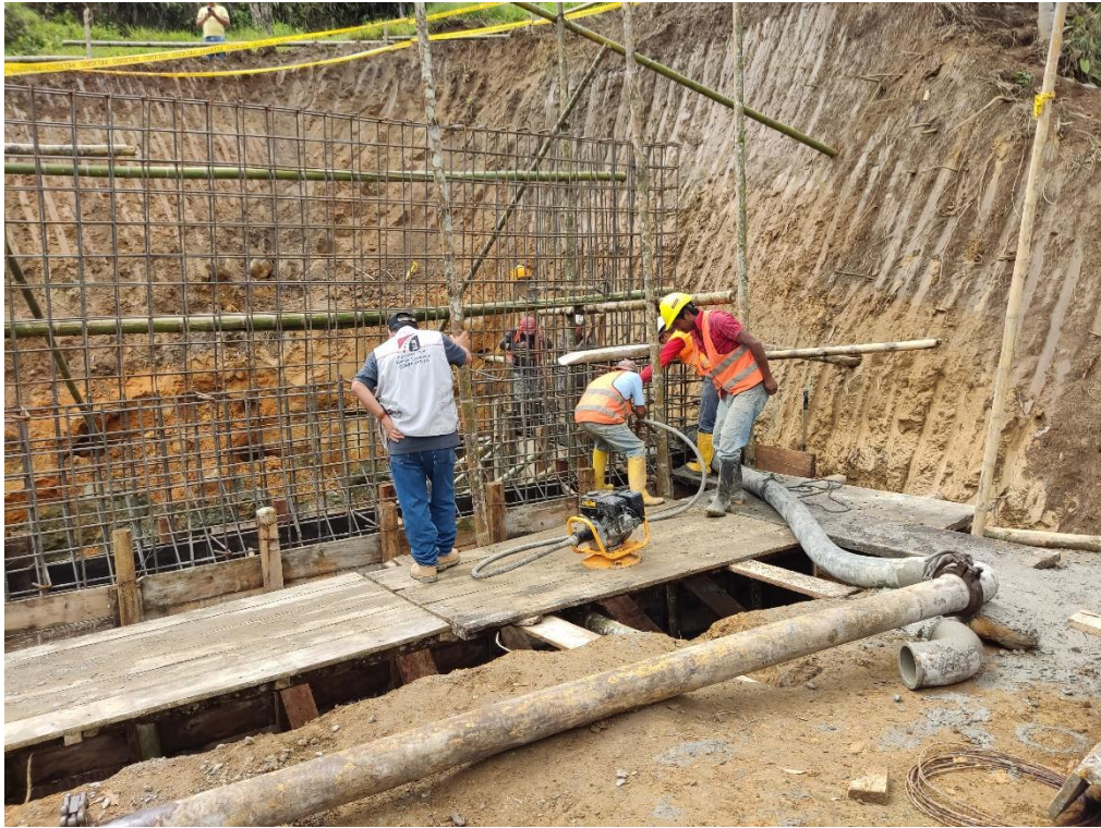
Anexo N° 14. Dotación del equipo de protección personal a los trabajadores.