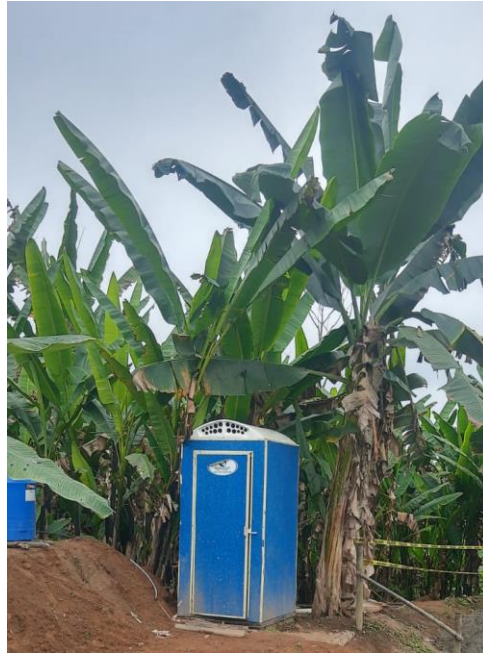
LETRINA 2: FRENTE DE OBRA 2+680