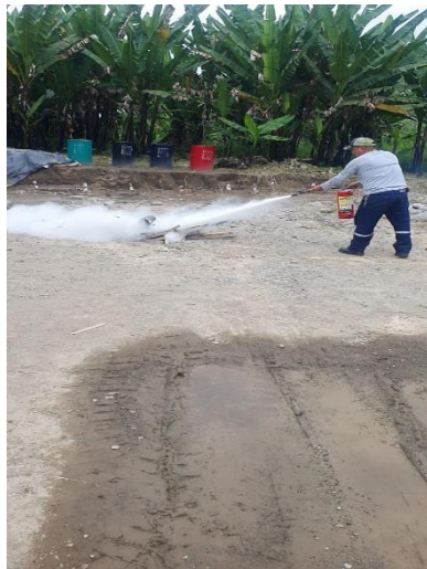
Ilustración 3 Control del conato de incendio