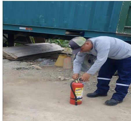
Ilustración 2 Uso adecuado del Extintor