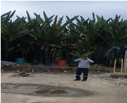
Ilustración 1 Inicio de la Emergencia