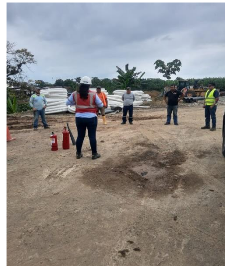
Ilustración 4 Socialización del simulacro