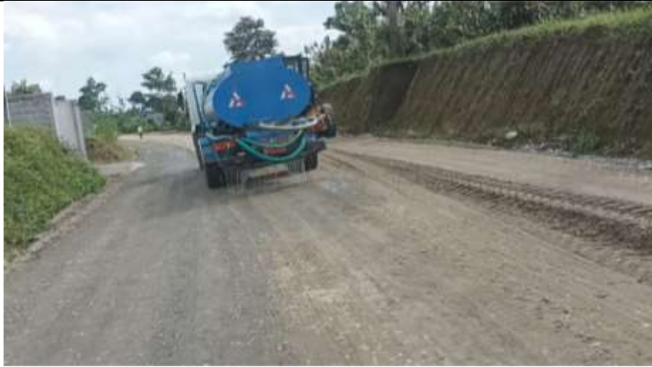
Registro fotográfico N° 01,02