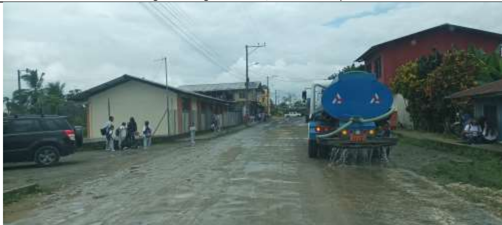
Registro fotográfico N° 01,02. control de polvo.